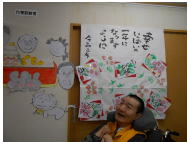
幸せいっぱい笑顔

( 利 Aさん ) それから、墨でねずみを描きました。ネズミ年やからね。ぼくはトラ年生まれやけど。